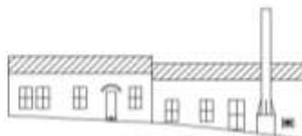
Схема фасада теплицы №3